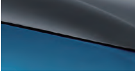
Sörf mavisi + Dağ grisi