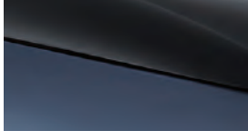
Atlantis grisi + Karbon siyah