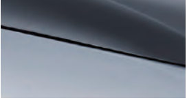
Kar beyazı + Dağ grisi