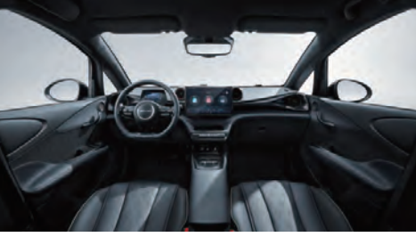
Siyah (Vegan deri)